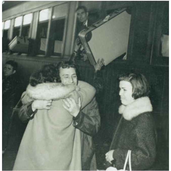
A mediados del siglo xx, muchos murcianos emigraron hacia países europeos y americanos.

Además, no hay que olvidar la presencia de un importante número de residentes extranjeros que proceden de la Unión Europea, y que tienen su segunda residencia en las costas murcianas.